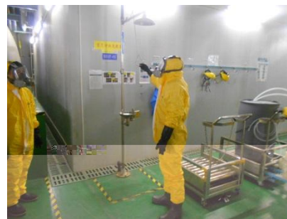
救灾完成后现场除污