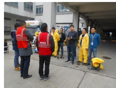
事故指挥官演习总结